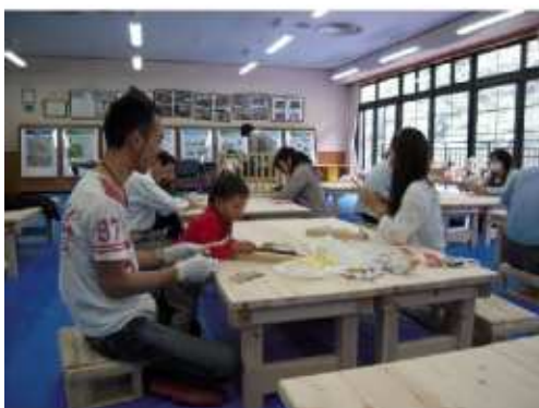
（赤ちゃんが初めて使う木のスプーン作り）