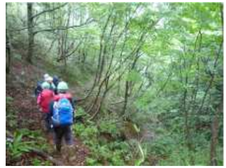
(門入地区現地調査)