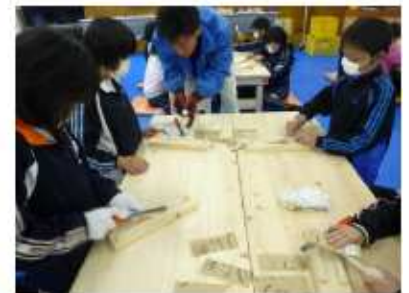
(木のスプーン作り)