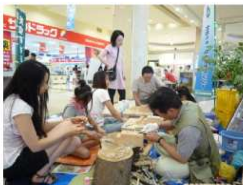
（クロモジの菓子楊枝づくり）