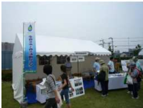
（名古屋水フェスタ）

「● 4/23/24 かすがモリモリ村・揖斐高原,4/28.29,5/1 ~ 5/4,5/14.15,6/1 ~ 3.5 徳山ダム堤体・鶴見亭,6/5 名古屋水フェスタ,6/8 ~ 10,6/14 ~ 18, 6/22 ~ 26,6/29.30,7/1 ~ 3,7/6 ~ 10,7/13.14.16.31 徳山ダム堤体,7/2.3 大垣ロックシティ,7/18 ぎふ清流の国づくり県民会議,7/23 坂内遊ランド」