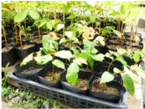
（ブナなど苗木育成）

「●7/4 下草刈り、6名参加、●7/9下草刈り・獣害防止カバー設置・施肥 参加63名、 ○11/3 実のなる木を植えよう大作戦 ○11/12 間伐体験」