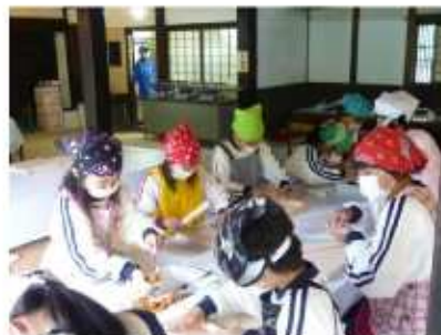
(サワアザミのおやき作り)