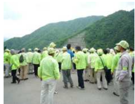
(徳山ダム見学案内)