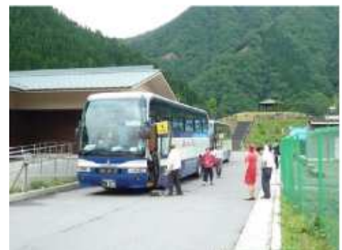
（水と森の学習館利用）