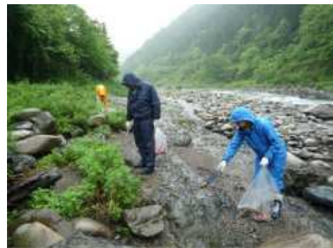
（揖斐川クリーン作戦）