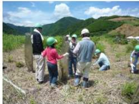
（下草刈り・獣害防止カバー設置）